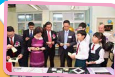
嘉賓在同學的解說下挑戰數理小遊戲。

最後，我們走到隔壁課室，來到「創藝天地」。這裏展示了學生的數學和視藝作品，視藝作品中既有平面的，也有立體的，盡顯同學的創意。數學科為配合60周年校慶，各級學生創作了不同的作品，例如年曆、「載夢飛航」行李箱等。除了觀賞這些專題作品，同學亦邀請嘉賓參與摺紙遊戲，摺出「鑽禧慶典」、「躍動生命」、「載夢飛航」等字樣，齊賀校慶！