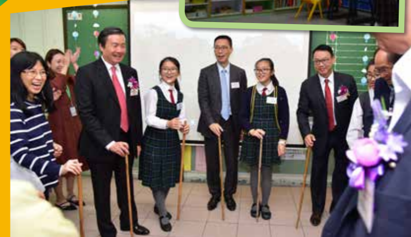
嘉賓和同學一同玩遊戲，場面樂也融融。

接着，小導遊引領嘉賓來到「校園多姿采」展館。同學分享自己在學校參與的各種活動，包括課外活動、聯課學習周活動等，言談間不禁流露出滿足和喜悅之情。同學又即席表演跆拳道和手鈴，一展體藝才能，贏得陣陣掌聲。