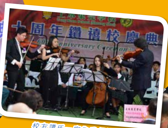
校友譚氏一家為我們演出，優美樂聲令人非常陶醉。