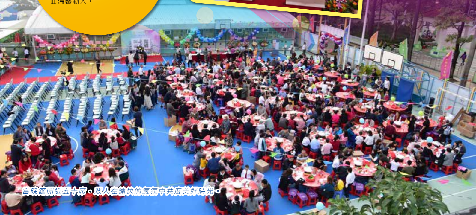
當晚筵開近五十席，眾人在愉快的氣氛中共度美好時光。