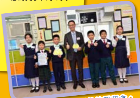
嘉賓和同學合演短劇後拍照留念。

之後，小導遊帶着嘉賓走進中文科展館「夢想此『中』尋」。在這裏，嘉賓在小導遊的熱情帶領下，從相片中感受到同學參與傳統節日活動的歡樂，了解到同學多姿多采的學習活動。另外，嘉賓又欣賞了同學豐碩的學習成果，他們更參與了同學創作的一齣短劇，扮演劇中的角色，與同學合作無間，氣氛樂也融融。