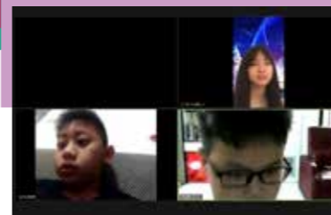
看看我們的小記者摘錄筆記的樣子多認真！