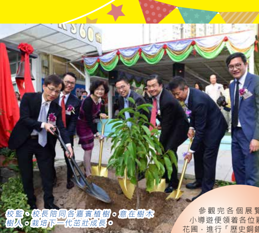
校監、校長陪同各嘉賓植樹，意在樹木樹人，栽培下一代茁壯成長。