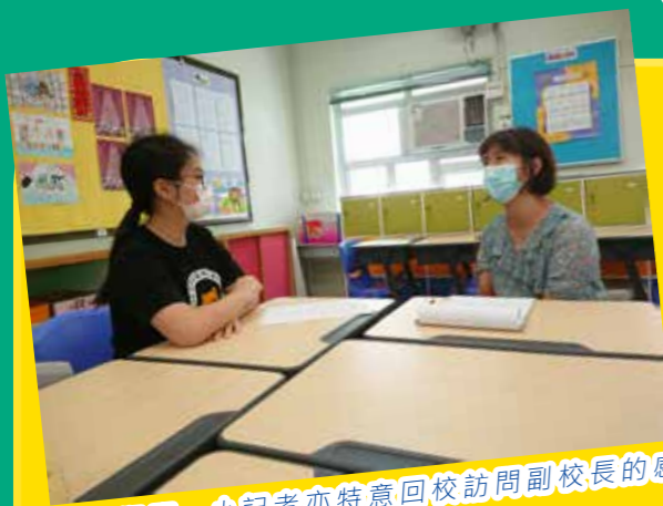
停課期間，小記者亦特意回校訪問副校長的感受。

作業，培養自學的習慣。經過這次停課，無論是老師抑或學生，都有學習到不同的事物，比如老師學習到網上授課的技巧，學生更加瞭解自學的重要性，最重要的是讓同學更加珍惜上課的機會。這次疫情對大家都是一個挑戰，大家要在短時間內適應不同的教學模式，因此我要在這裏再次讚揚我們的老師，在互相共勉之下也真的為學生付出了不少心力，也希望在復課之後，可以見到學生的成長。