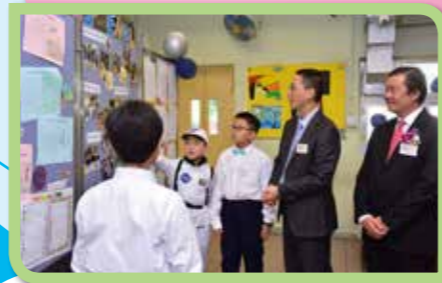
同學穿上太空裝，生動地為嘉賓介紹Space Town課程。

來到英文科展館「TKS Explorer」，同學向嘉賓介紹本校推行的Space Town課程內容。課程中有一些切合日常生活的有趣語文活動，例如製作蛋糕、動物面具、五味活動等。當天，同學把在英文課上學到的知識應用出來，即場焗製蛋糕，讓嘉賓一邊享用美點，一邊觀看片段，了解同學的英語學習生活，並欣賞同學的作品。