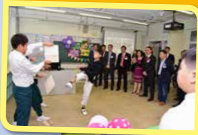
同學精彩的跆拳道表演令一眾嘉賓目瞪口呆，拍手叫好！

接着，小導遊引領嘉賓來到「校園多姿采」展館。同學分享自己在學校參與的各種活動，包括課外活動、聯課學習周活動等，言談間不禁流露出滿足和喜悅之情。同學又即席表演跆拳道和手鈴，一展體藝才能，贏得陣陣掌聲。