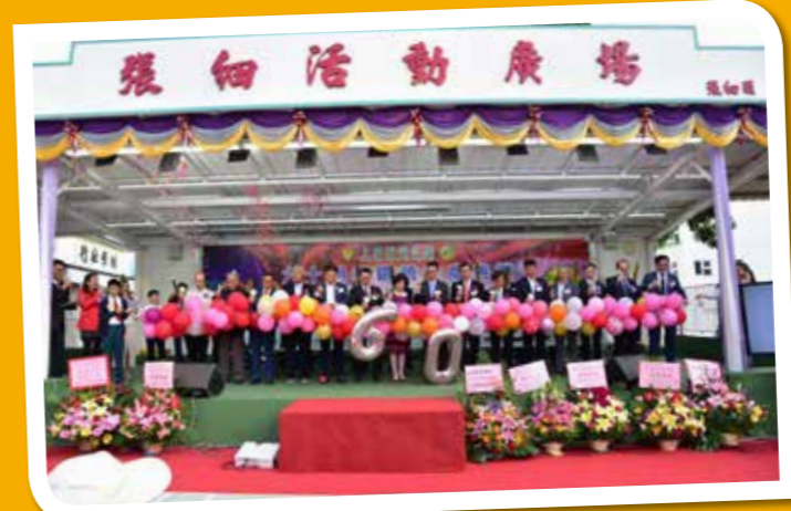
各主禮嘉賓為我院校慶典禮揭開序幕。

典禮完畢後，嘉賓、校友和師生一邊欣賞爵士舞隊和跳繩隊的表演，一邊享受盆菜宴，大家開懷暢飲，共度美好時光。之後，台上更有拍賣活動，拍賣品均為校友捐贈的個人創作，彌足珍貴。夜幕漸深，校慶開放日來到尾聲，難得聚首一堂的校友和師生都擁抱着美好的時光，紛紛拍照留念，場面溫馨動人。