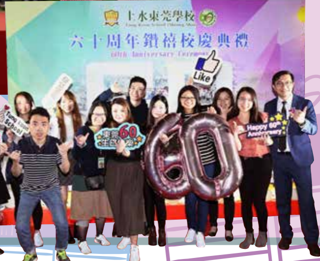
一眾畢業生聚首一堂，共賀母校鑽禧。

我們十分感謝當天抽空出席典禮的來賓，亦多謝提供協助的各個單位，和眾多家長、校友多年的支持和鼓勵。在此祝賀我百尺竿頭，更進一步。