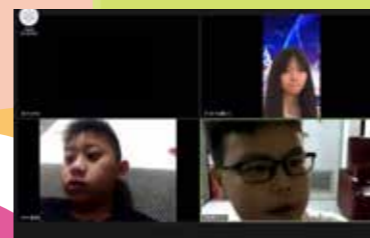
雖然沒有面對面訪問，但大家都非常認真，絕不怠慢！