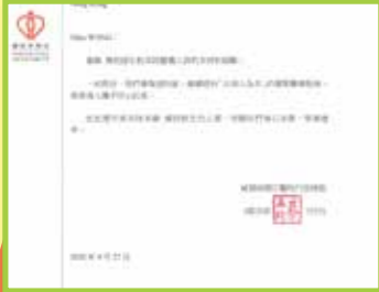
威爾斯親王醫院行政總監回信致意。

在個人方面，期望同學們學會愛護自己，探索和學習疫情相關知識，例如：了解抗疫方法、保持個人衛生、實踐健康生活日程，復課後以健康的體魄回歸校園。在「愛己」的同時，亦要學會「愛人」，愛家人、愛親友、愛鄰舍。我們讓同學們設計書籤、課室公約互相提醒，防範疫症如「沙士」捲土重來；鼓勵同學們摺花送上感謝和祝福，因為感謝是愛的第一步。我們固然希望同學們努力在「網上教室」進行遙距學習，但生活在同一天空下，你我都是缺一不可的拼圖，彼此共生共榮。「愛己」、「愛人」，更要學會「愛社會」，在有需要的人士身上看見自己的義務。去年十二月至今，各界嚴陣抗疫。前線醫護在物資緊絀的情況下衣不解帶地當值，過家門不敢入。專題的其中一部分讓同學們設計心意卡，為各界打氣。而給醫護人員撰寫的書信，已經由老師送到醫護人員手上，向他們送上愛與關懷，讓同學們知道，他們的鼓勵和祝福是前線醫護人員與這場疫症作戰的最強武器。