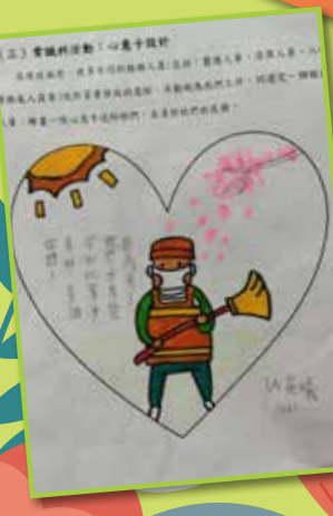
同學亦有繪圖向不同崗位的人致謝。

在個人方面，期望同學們學會愛護自己，探索和學習疫情相關知識，例如：了解抗疫方法、保持個人衛生、實踐健康生活日程，復課後以健康的體魄回歸校園。在「愛己」的同時，亦要學會「愛人」，愛家人、愛親友、愛鄰舍。我們讓同學們設計書籤、課室公約互相提醒，防範疫症如「沙士」捲土重來；鼓勵同學們摺花送上感謝和祝福，因為感謝是愛的第一步。我們固然希望同學們努力在「網上教室」進行遙距學習，但生活在同一天空下，你我都是缺一不可的拼圖，彼此共生共榮。「愛己」、「愛人」，更要學會「愛社會」，在有需要的人士身上看見自己的義務。去年十二月至今，各界嚴陣抗疫。前線醫護在物資緊絀的情況下衣不解帶地當值，過家門不敢入。專題的其中一部分讓同學們設計心意卡，為各界打氣。而給醫護人員撰寫的書信，已經由老師送到醫護人員手上，向他們送上愛與關懷，讓同學們知道，他們的鼓勵和祝福是前線醫護人員與這場疫症作戰的最強武器。