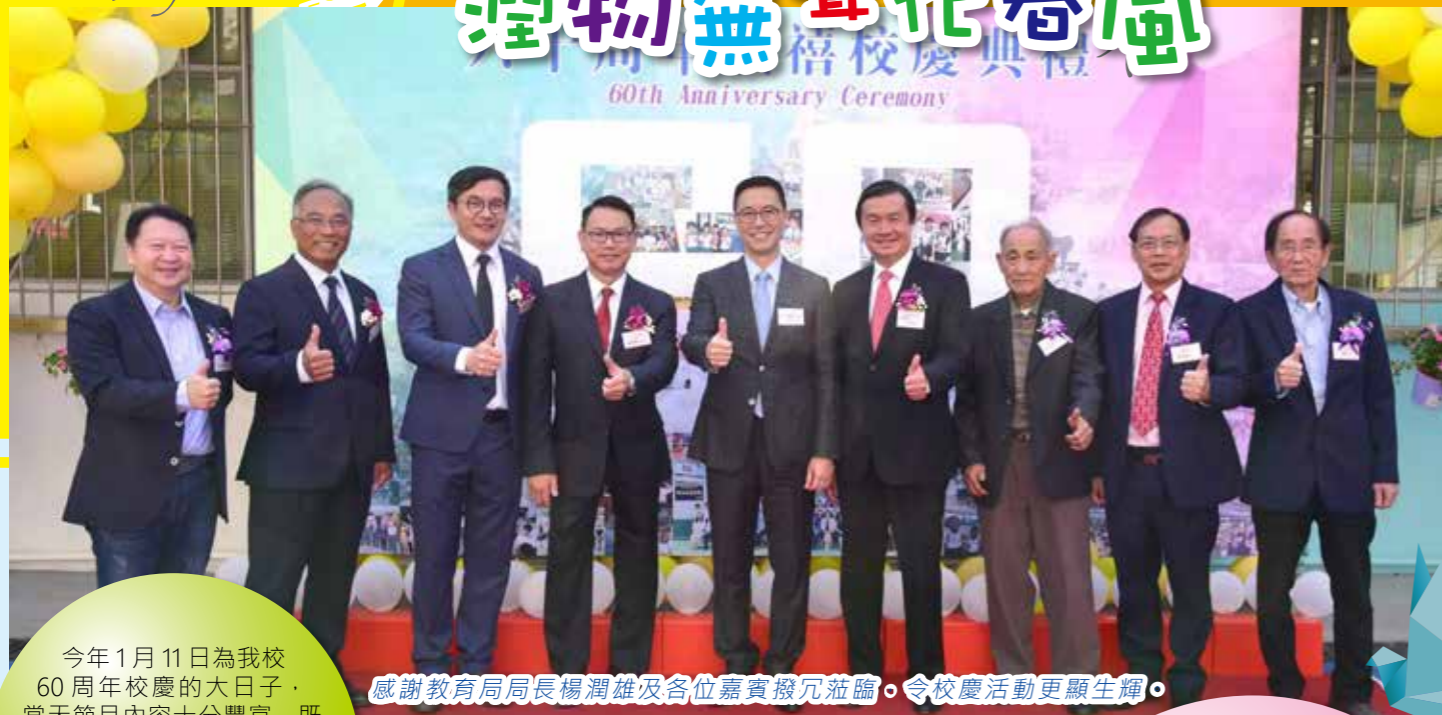
感謝教育局局長楊潤雄及各位嘉賓撥冗蒞臨，令校慶活動更顯生輝。

今年1月11日為我校60周年校慶的大日子，當天節目內容十分豐富，既設有展覽館向來賓介紹本校特色，也有慶典、表演、盆菜宴等節目讓大眾共聚一堂，慶賀學校鑽禧，讓我們一起回顧當天的盛況吧！