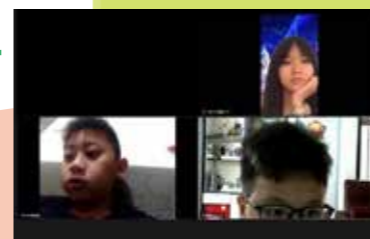
這次訪問破天荒以 Zoom 形式進行，仍然難不到我們的同學完成訪問。